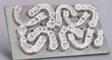
Chirurgieschablonen bis zu 10 Chirurgieschablonen