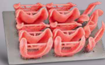
Prothesenbasen bis zu 13 Zahnprothesenbasen