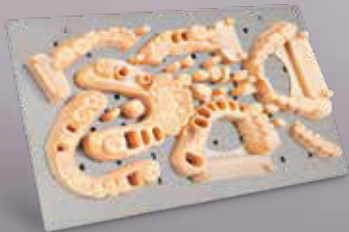
Meister Modelle bis zu 6 Modelle

Mehr als 200 Harze ermöglichen über 15 dentale Anwendungen